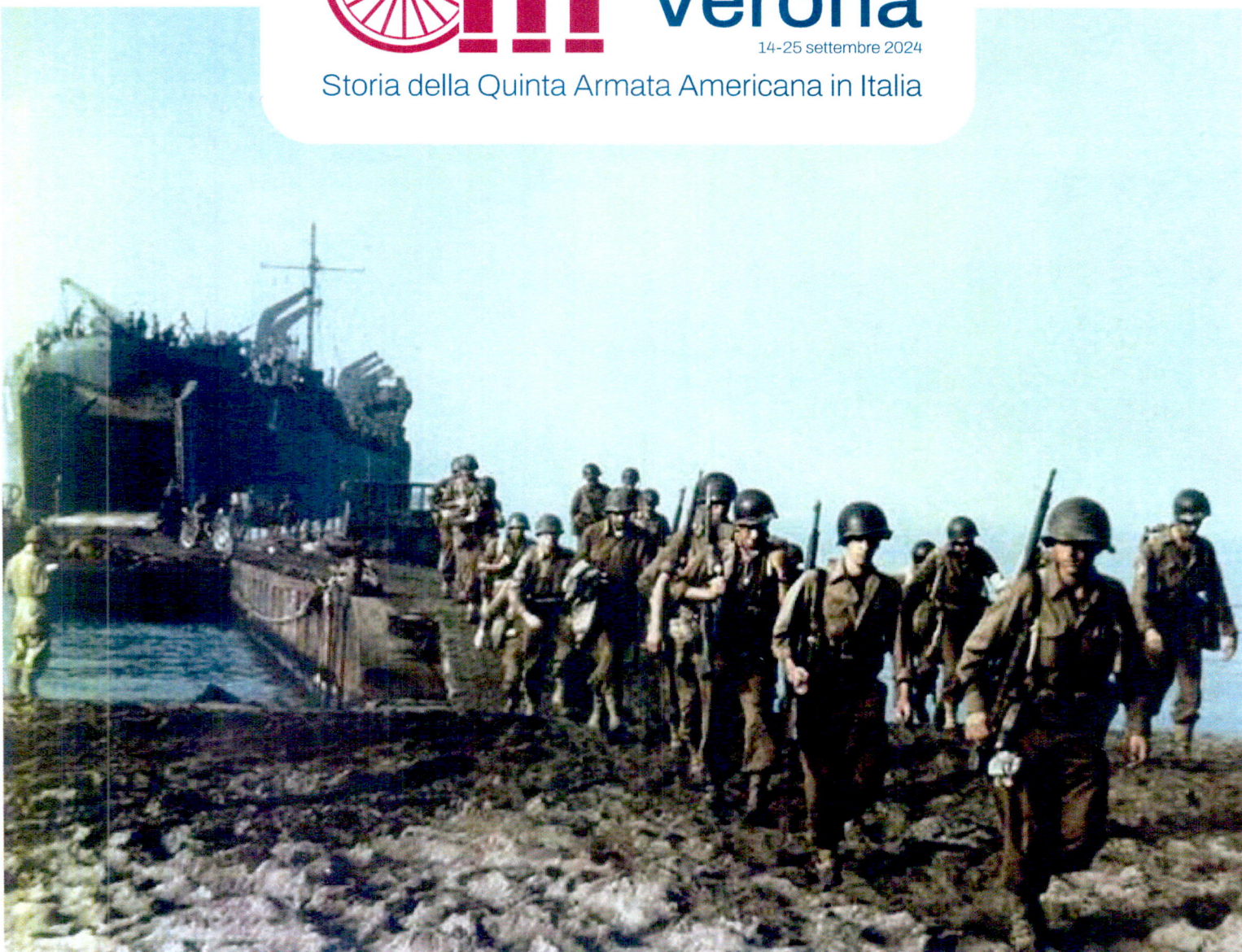
TABELLE DI MARCIA

Storia della Quinta Armata Americana in Italia